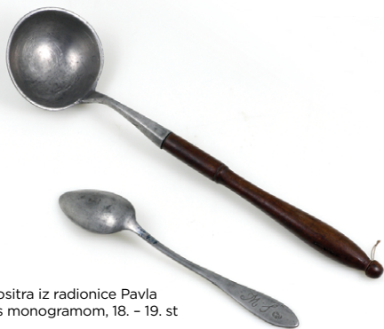
Zaimača od kositra iz radionice Pavla Nežića i žlica s monogramom, 18. – 19. st

Priprema se tako da se izrezane gljive kuhaju u vodi s narezanim mladim ili starim lukom, a kad zavriju dodaje se na kockice izrezan krumpir. Kad je juha gotovo kuhana, dodaje se „zafrig“ od sitno narezanog luka preprženog na ulju ili masti te zaprašenog brašnom i crvenom paprikom. Kad prokuha, dodaje se ocat, a po želji i nekoliko žlica vrhnja te se, kad proključa, iznosi na stol.