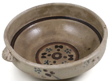
Zdjela od keramike korištena u okolici Samobora, 20. st.

Krpice se rade na sljedeći način: mekano brašno, mlijeko, 3 do 5 jaja i svježi kvasac se pomiješaju, umijese i ostave stajati oko 20 minuta. Ponovno se mijese i razvaljuju na debljinu od oko 5 mm te nožem režu na pačetvorine od 5 do 8 cm, a potom se nožem zarežu u sredinu (kako bi se bolje skuhalo i savijale kod kuhanja). Zelje se kuha zasebno, a pred kraj se u njega (nakon što se odlije voda) umiješaju kuhane i procijeđene krpice.