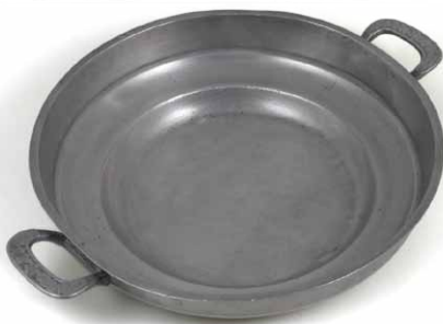
Kositrena zdjela obitelji Praunsperger. Samoborska radionica kositra, 18. - 19. st.

Kruh se nareže na šnite i popeče po ploči štednjaka da bude suh te se poreda po zdjeli. Preko kruha se sipa crno ili crveno vino u kojem je razmućeno nekoliko žlica šećera (količina šećera ovisi o kiselosti vina i količini kruha). Kruh mora plivati u vinu te se na površini popraši s malo cimeta.