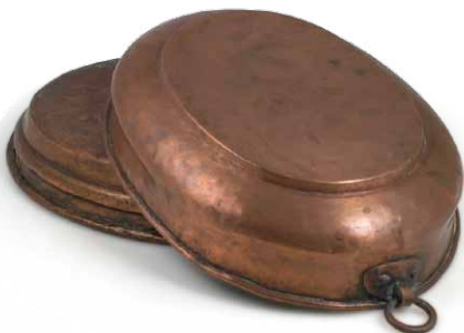
Bakrene zdjele, medenice za pečenje. Samoborska radionica bakra, 18. - 19. st.

Umijesi se tijesto od brašna, malo tople vode i soli te se suče u tanke kore. Skuhani, ocjeđeni i nasjeckan špinat ili na isti način pripremljena blitva, poriluk, medvjedi luk, lišće od repe ili kopriva pomiješa se s ostalim sastojcima te se stavlja na uljem namazanu koru. Smjesa se stavlja na jedan kraj kore, savija se te se na zamašćen protvan slaže za pečenje. Peče se na 200 stupnjeva, sve dok ne porumeni. U nadjev zelenače može se staviti i dvije do tri žlice vrhnja da bude sočnija.