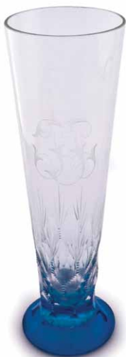
Čaša od brušenog stakla s monogramom iz ostavštine obitelji Wiesner - Livadić.

Umijesiti i razdvojiti u četiri dijela (lista), potom peći. Prvi dio se fila orasima, drugi marmeladom od ribiza, treći neoljuštenim bademima u mlijeku s vanilin šećerom. Glazura: 28 dag šećera, 6 žlica ribiz marmelade.