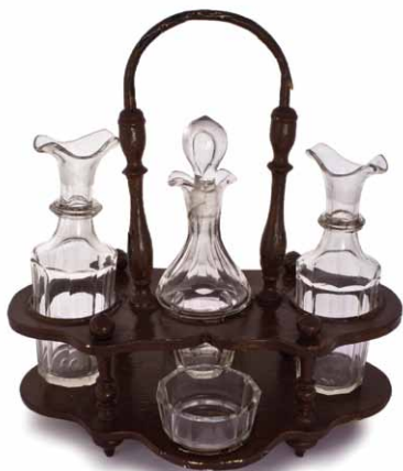
Stolna garnitura za začine. Staklana Osredek, 19. st.

Šprudla se (miješa se vrtlicom) u pari dok se diže, pomiješa sa sardelenputrom (riblja pašteta) i toplo servira.