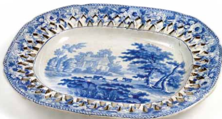
Tanjur za kolače od engleske keramike (Davenport), 19. st.

Od navedenih sastojaka treba dobro „isklofati“ tijesto i dva puta staviti na toplo da se „diže“. Tijesto se potom razvalja na oko 1 cm debljine. S dvije čaše (šireg i užeg opsega) pritisnu se okrugli otisci. Na šire otiske se stavi malo domaće marmelade te se oni preklope s užim otiskom i zatim se prže u dubokoj masnoći dok ne dobiju smeđu boju. Svijetli „prsten“ znak je da su krafli uspjeti.