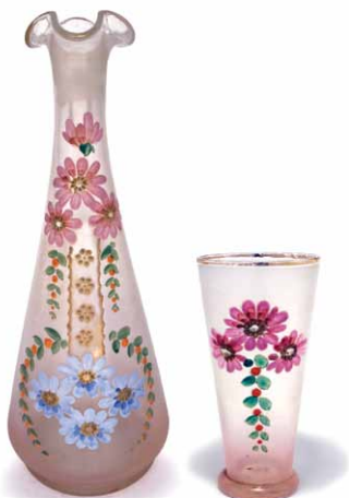
Boca i čaša za vino od oslikanog stakla. Staklana Osredek, poč. 20. st.

Svi sastojci stave se u hladnu vodu i kuhaju na laganoj vatri do pet sati (da se meso polako raspada). Ako obitelj voli ljuto, dodaje se malo feferona. Kada je sve skuhanu i procijeđeno od povrća, još toplo se sipa u široku zdjelu ili tanjuru, a u sredinu se stavlja kuhano jaje. Čuva se na hladnom.