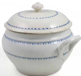
Jušnik od keramike

Dok se štrukli kuhaju, na masti ili ulju se preprži sitno nasjeckani luk, doda mu se malo brašna i crvene paprike te se sve stavlja u juhu. Po želji se dodaje i nekoliko žlica vrhnja koje mora proključati.